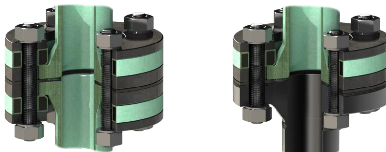
Abb.7: regelkonforme, betriebssichere GFK-Flanschverbindungen nach Stand der Technik

Die modifizierte Flanschverbindung ist um den Faktor 3,5 höher verspannt als die Standardverbindung. Damit ist sie erheblich betriebssicherer als die übliche Verbindung. Sie könnte noch ca. doppelt so hoch verspannt werden, ohne eines der Bauteile zu überlasten. Die folgende Abbildung (Abb.7) zeigt die Umsetzung in marktüblichen GFK-Flanschverbindungen mit Bunde und Losflanschen sowie die Umsetzung bei einer Verbindung GFK-Flansch mit Bund und Losflansch gegen einen Vorschweißflansch.