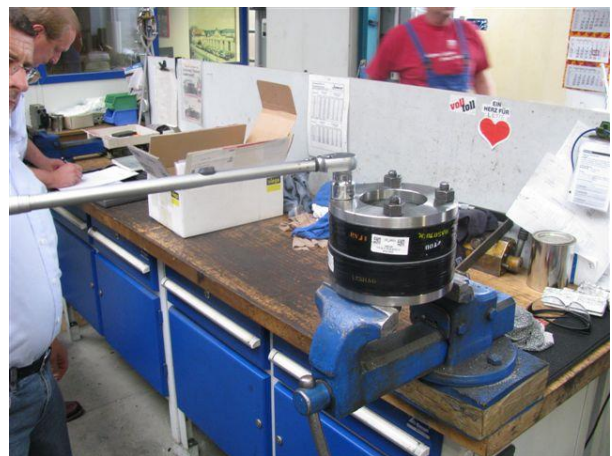
Abb.4 und Abb.5: Vormontage und Montage