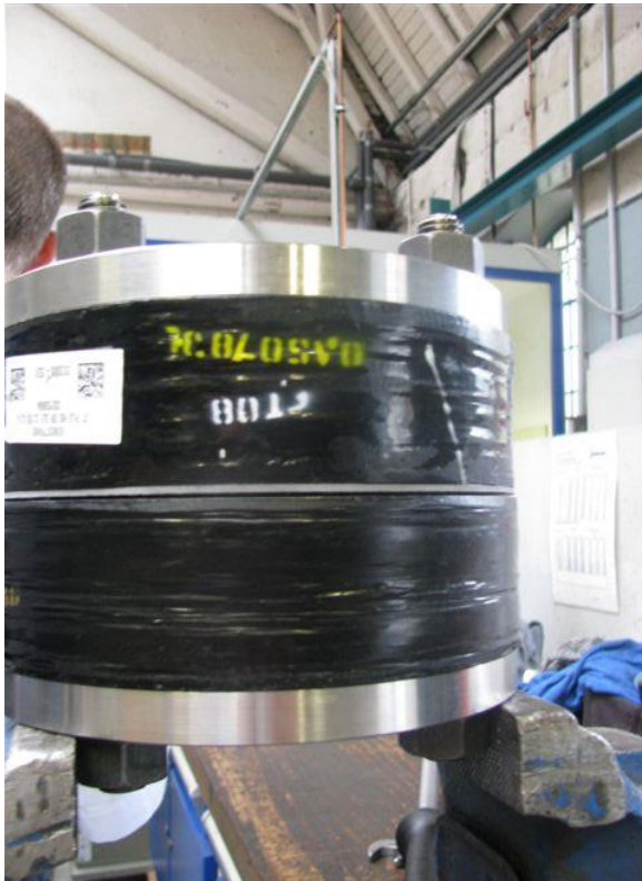
Abb.3: Gesamtansicht der Verbindung, in der Mitte ist der Stützring der Dichtung zu erkennen

Zwischen die Druckscheiben werden die GFK-Flansche mit der mittig eingebrachten Dichtung verspannt (Abb.3). Die Verbindung wurde mit Maulschlüsseln leicht vormontiert (Abb.4). Die Schraubenkräfte werden mittels geeichtem Drehmomentschlüssel in Schritten von 100, 160 und 200 Nm über Kreuz aufgebracht (Abb.5). Mit 200 Nm wird als letzter Montagegang noch einmal jede Schraube im Kreis nacheinander angezogen. Um die Reibzahl 0,12 einigermaßen sicher einzuhalten, werden die Gewinde und Mutternauflageflächen mit einer Schraubenpaste versehen. Bei 200 Nm soll die Schraube mit 70% R_{p0,2} ausgelastet sein, das \Delta l soll bei 0,32mm liegen. In den folgenden Tagen wird die Relaxation der Schrauben gemessen.